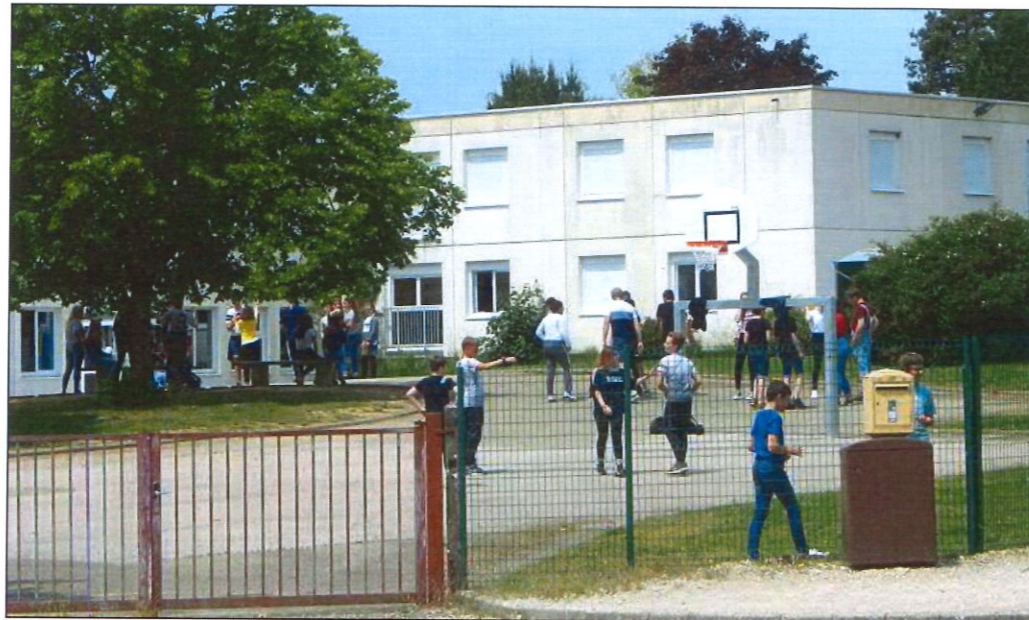
Le collège de Cuiseaux accueille actuellement 360 élèves, celui de Saint-Amour 199.

Les parents jurassiens se mobilisent pour que leurs enfants continuent à pouvoir fréquenter le collège de Cuiseaux et ne soient pas contraints à se rendre à Saint-Amour.