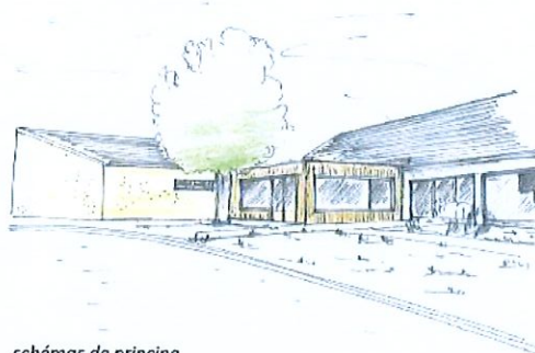
schémas de principe