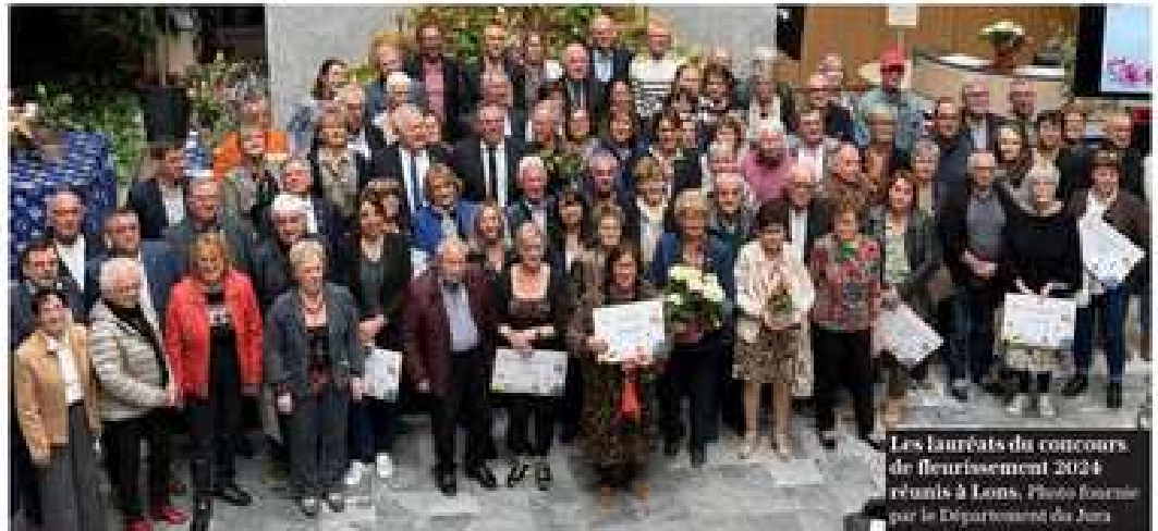
Les lauréats du concours de fleurissement 2024 réunis à Lons.

C'est à l'hôtel du département qu'a eu lieu vendredi dernier 21 mars, l'incontournable remise des prix du concours des villes et villages fleuris. Elles sont 29, parmi les communes jurassiennes, à compter désormais une, deux ou trois fleurs attribuées par le jury départemental (la 4 e relevant du jury national). Mais bien d'autres ont aussi été mises à l'honneur au cours de cette réception. Ce concours, lancé en 1970 par le ministère de l'Agriculture, vise aussi à récompenser tous ceux qui mettent en valeur des petits bouts de notre territoire. Mairies, commerces, particuliers... ont donc aussi été nombreux à voir leur nom inscrit au palmarès.